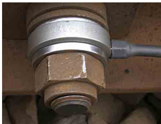
Sensors on the frog measure the preload force.

Schockfest bis 30 g und für den Außeneinsatz im Gleis geeignet. Die ermittelten Messwerte werden von einem Datensammler aufgezeichnet und können via Datenfernübertragung an übergeordnete Systeme weitergeleitet werden.