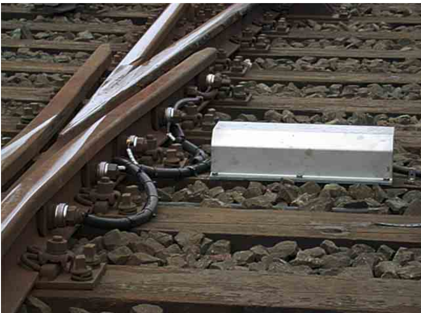
Sensoren am Herzstück messen die Vorspannkraft.

Der Einbauort des Sensors liegt dabei direkt vor der Bolzenwindmutter und somit im unmittelbaren Wirkungsbereich der zu ermittelnden Kräfte. Maximal lassen sich Kräfte bis 400 kN aufnehmen. Der Sensor erfüllt die Schutzklasse IP68, er ist